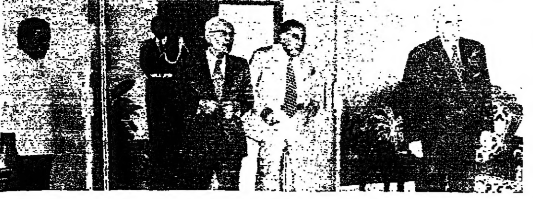
الرئيس فرنجية والرئيس حمادة في مقر الرئاسة الصيفي في طرابلس - من مكتبها عدد من نواب محافظة البقاع المشكل (الاتوار) : الحاجات الماسة المتعلقة ببقاع علاج رئيس الجمهورية اسمر مع الشفة وأوضاع والنموذج الآخر

وقررها من القضايا التي تهم منقظهم . وقد استقبل الرئيس فرنجية في مكتبه بقره الصيفي ويحدث على التوالي الرئيس السادة : جوزيف السكاف وسليم الداود والنائب السابق انطوان الهراوي ثم الرئيس صبري حماده . وقد تناول الرئيس حماده طلع الفداء عيسى مائدة رئيس الجمهورية .